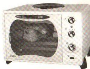
Model No: C-30-1WRC