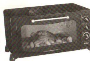
Model No: C-38-BC