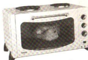
Model No: C-38-2WRC