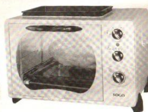
Model No: C-30-WT