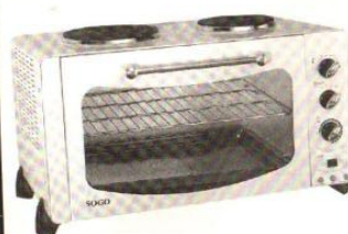
Model No: C-38-2W